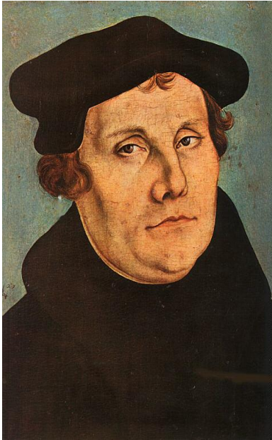
Maarten Luther (1483–1546)

‘Salomo heeft Prediker niet geschreven. Het is door Jezus Sirach, in de tijd van de Makkabeeën, ontstaan.’